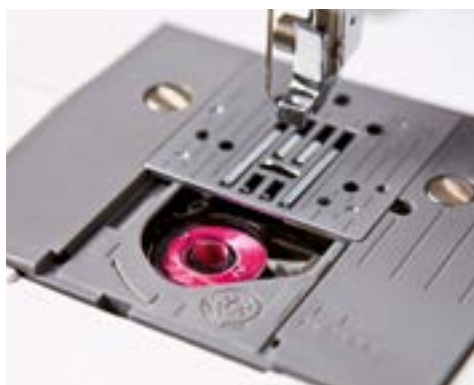
Bobina con carica dall'alto