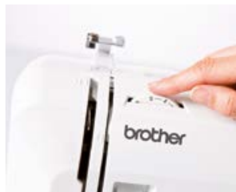
Facile regolazione della tensione del filo

Per ulteriori informazioni, rivolgersi al proprio rivenditore o visitare il sito sewingcraft.brother.eu .