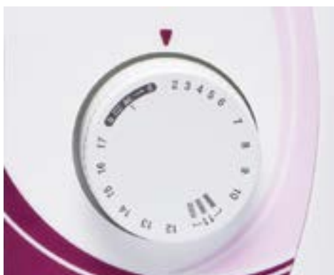
Facile selezione del punto mediante manopola